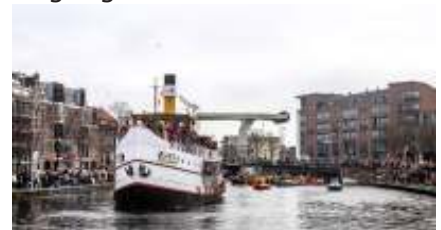
Voorgaande jaren kwam Sinterklaas met entourage per grote witte pakjesboot.

van Haarlems Dagblad ging op onderzoek uit. Een belletje naar het geheime nummer van de Sint maakt duidelijk dat het niet om een dichte, maar om een kapotte brug gaat. Dat vertelt zijn vaste vrouwelijke hulppiet die de telefoon opneemt. Goedheiligman blijkt zelf maandagmiddag in het vliegtuig te zitten.