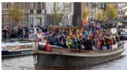
De bescheiden boot van Sinterklaas dit jaar.

Haarlem Zondagmiddag zetten Sinterklaas en zijn Pieten weer veilig voet aan wal in Haarlem. Toch keken volwassen toeschouwers met een schuin oog over het Spaarne: waar is de oude vertrouwde pakjesboot gebleven?